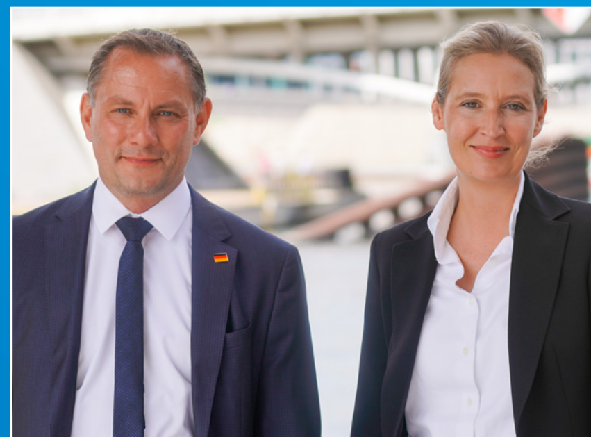
Tino Chrupalla und Dr. Alice Weidel