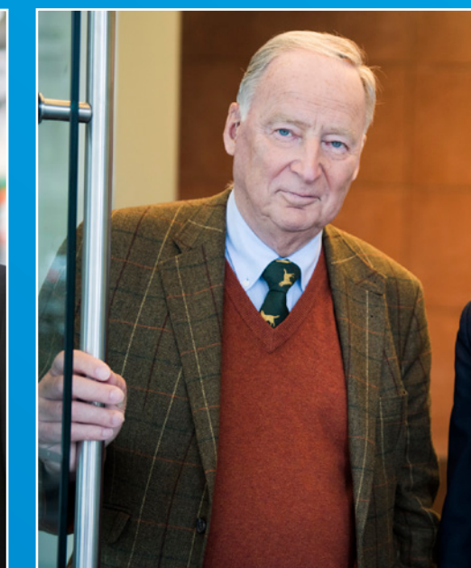
Dr. Alexander Gauland